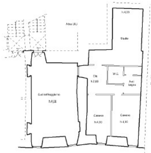
PIANO PRIMO VIA XX SETTEMBRE